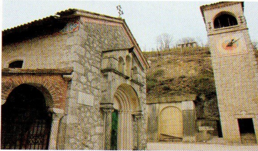
Santuario di Collagù.

Un altro cambiamento di programma! Questa volta dettato dal desiderio di non perdere questa bella gita sui colli trevigiani, annullata a Febbraio, che completa l'escursione già effettuata in passato ( da Guia a Vidor) sulla catena collinare pedemontana, che parte da Vittorio Veneto e termina a Vidor.